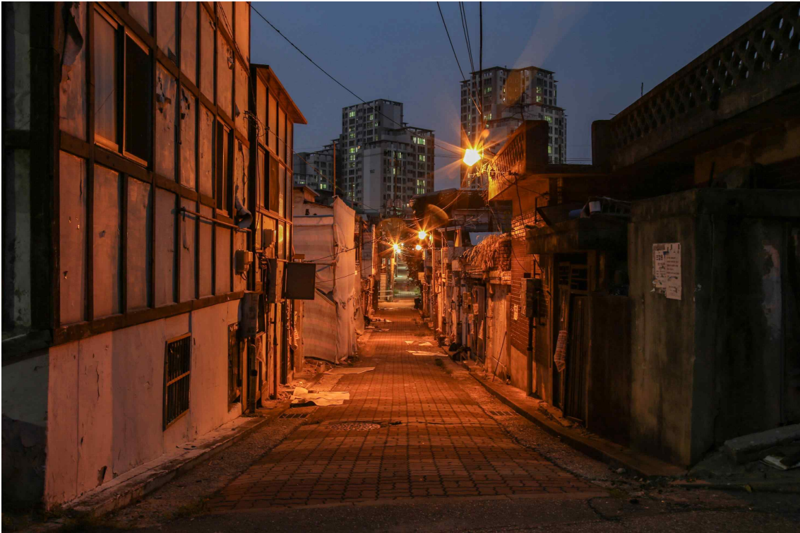
2016.8.8.일 달맞이길 도로에는 어둑어둑해 질 무렵 퇴근하시는 아버지들께서 골목에 들어오실 때 아이들에게 줄 무언가를 들고 지친 하루를 가족과 함께하시려 바빠 움직였으리라.