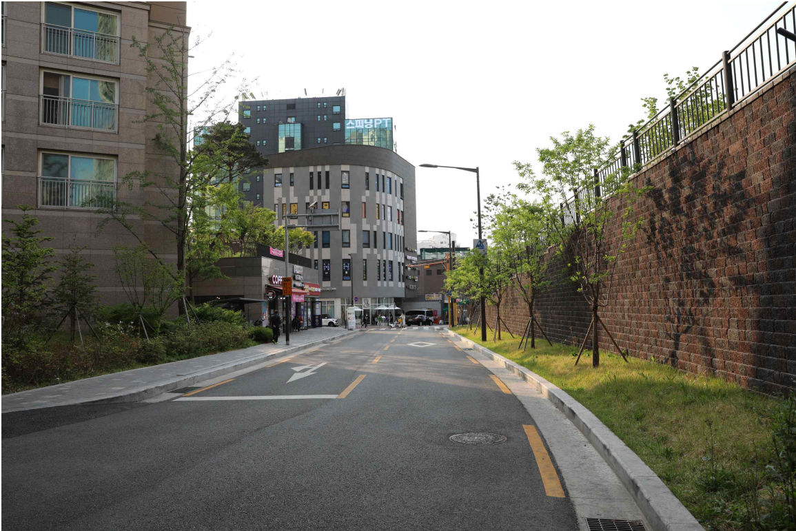
2022. 5. 20. 달맞이길에 자리한 도로의 한 모습을 촬영해 본다. 주변은 상가와 화단으로 되어있고, 이 길이 중심 도로의 한 부분이 되어있다.