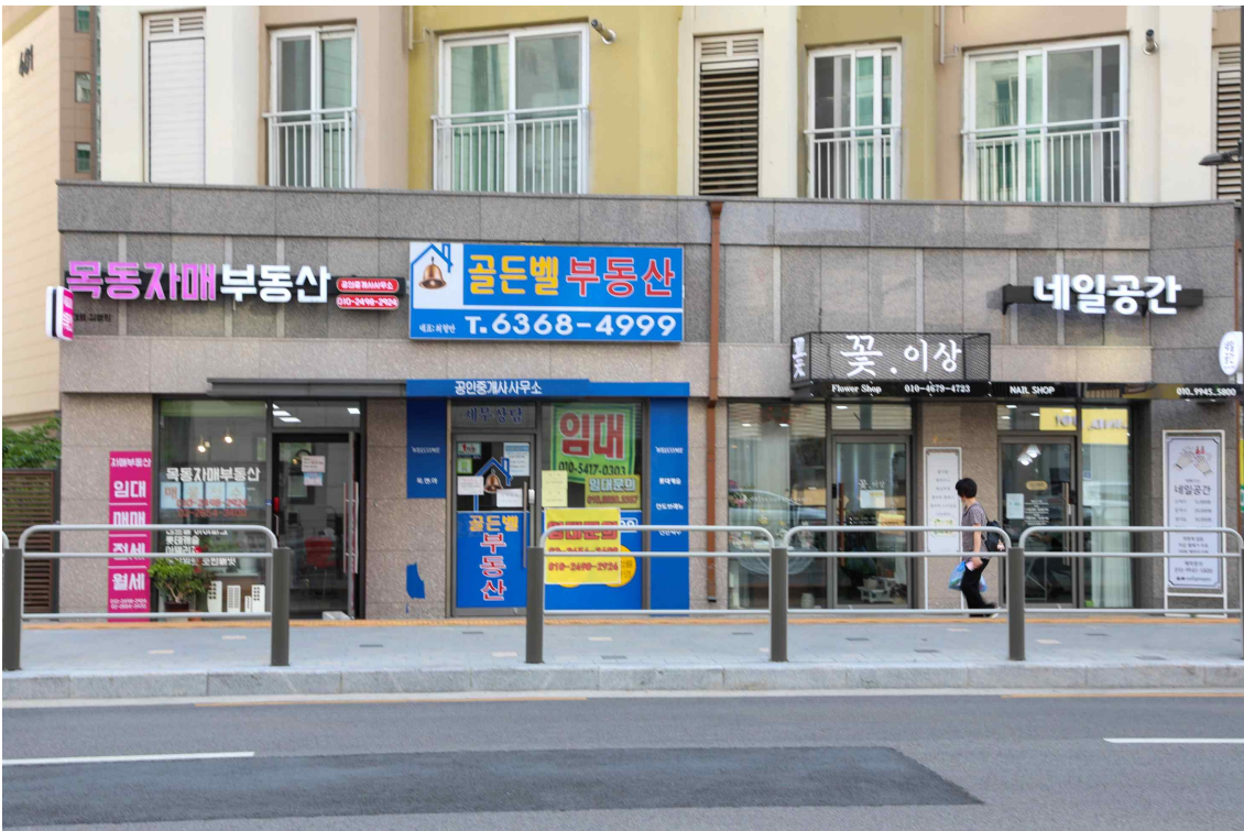
2022.5.20. 아파트와 공존하는 주상복합 상가를 촬영해 보았다. 단독주택 앞에 있던 그 시절 상가는 없어졌다.